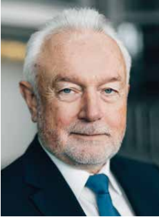
Vorabend 18:40 Uhr KLARTEXT zur Lage der Nation