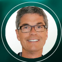
HARALD ROTTES CITTI Handelsgesellschaft mbH & Co. KG