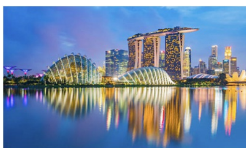
Singapore – Skyline in der Dämmerung

Eine ganz besonders anspruchsvolle Reise, die enorme Erkenntnisse, spitzen Brancheneinblicke und -kontakte sowie jede Menge Neues in petto hat, erwartet uns in 2 Monaten. Langsam gehen die Reiseplanungen auf die Zielgerade, letzte Flüge werden gebucht, das schönste Hotelzimmer reserviert und die Spannung steigt!